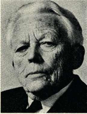
Hermod Lannung (S 14):

har øvet en meget stor indsats på det politiske område både lokalt, nationalt og internationalt. Hjelpearbejde i Rusland for Røde Kors, borgerrepræsentant, medlem af Landstinget senere Folketinget, i Forenede Nationer som Danmarks repræsentant i næsten 20 år og i Europarådet i 18 år. (Se Soranerbiografier 1900-60).