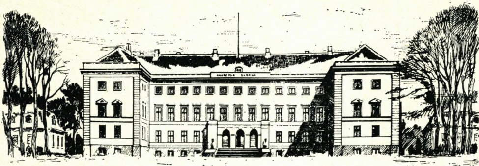
C.W. Tom-Petersen Academia Sorana