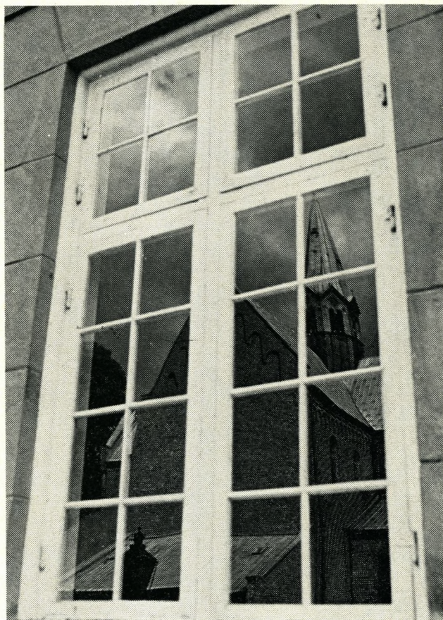
Kirken spejler sig.