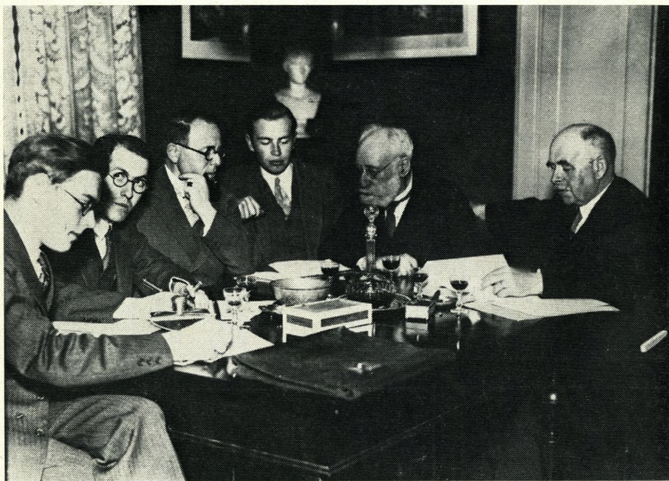
Bestyrelsesmøde i Soransk Samfund 1932