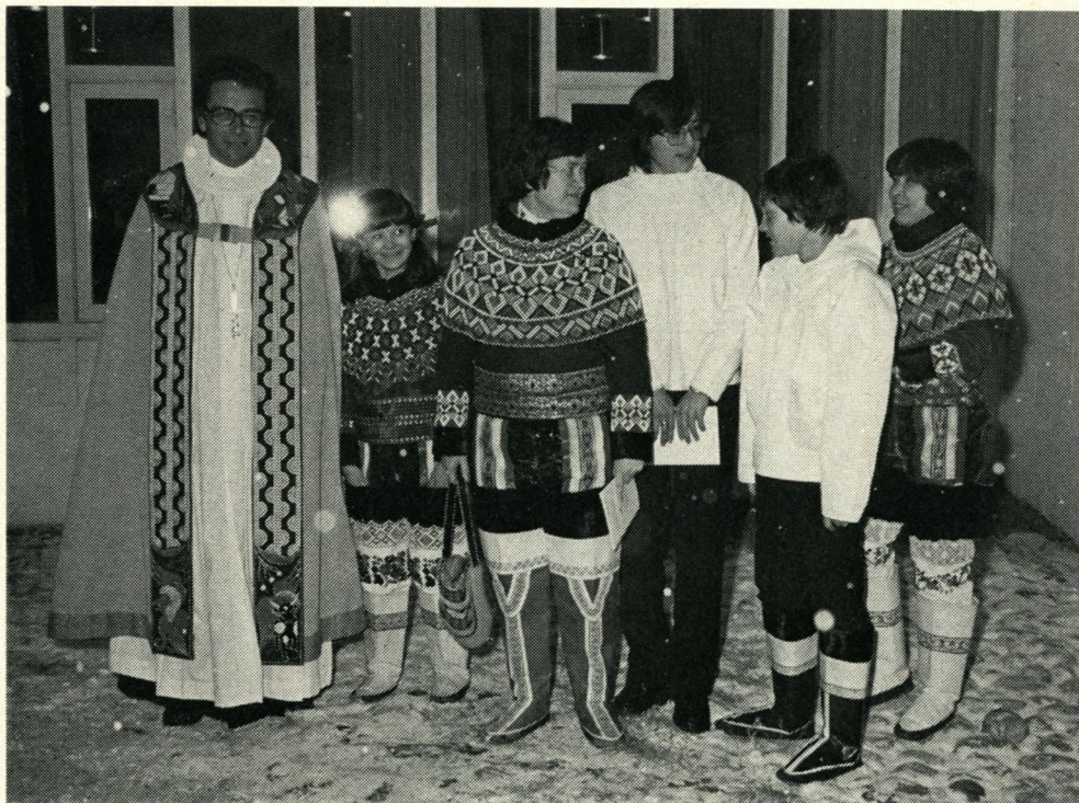
(Louise Inger Lyberth, fot.).