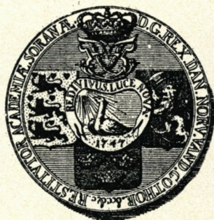
2. Sorø Akademis segl fra 1747, hvori man for første gang møder Fønixen, det mærke, som for alle gamle soranere har stået som skolens egentlige symbol, og nu er indgået i dens våben. Efter Soranerbladet.

Det er ved akademiets genopståen i 1747, at Fønix-symbolet benyttes første gang. Det var året efter Frederik 5.s tronbestigelse, og det genoprettede akademis nye signet (se figur 2) viser i midten en Fugl Fønix, »som opføres af sin egen aske ved strålerne af den opgående sol«, sammen med devisen »Genfødt ved det Nye Lys«. Redivivus Luce Nova . Dette segl har næppe huet Holberg, som i Epistel 247 og 248, trykt i 1750, raillerer over uvidende folks tro på Fugl Fønix og deres detaljerede »viden« om dens natur og vaner.