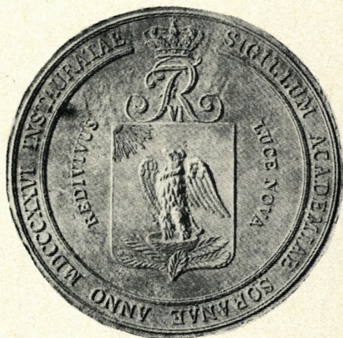
3. Sorø Akademis segl fra 1827. Her er kongens tre våbener udeladt, og kun den af solen genoplivede Fønix bibeholdt, stående i en rede af palmeblade. Dette sigil, med indskriften »Sigillum Academiae...« blev senere kasseret, vistnok da »Akademiet« ophævedes i 1849 (sondringen mellem »Akademiet« og »Skolen« er indviklet og uden betydning i denne forbindelse. Den nuværende, officielle betegnelse er »Sorø Akademis Skole«!). Efter Soranerbladet.

Efter forhandlinger og noteudvekslinger herom undertegnedes endelig den 1. september 1819 en overenskomst, hvori den danske konge forpligtede sig til at udslette den norske løve af sit våben, og til at hverken han eller