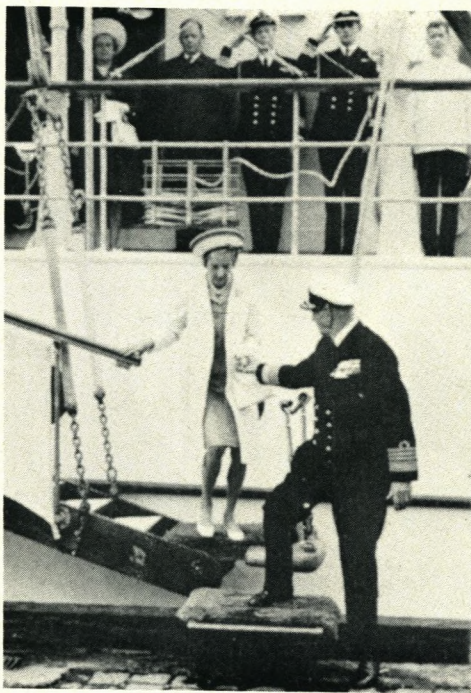
Kong Frederik d. 9. og Dronning Ingrid stiger i land fra kongeskibet Dannebrog ved kaj i Klaksvig på vej til indvielse af Christianskirken.

»Hold fast«, råbte skipper, at søen brød indover rælingen på fiskekutteren, og da faren var ovre, kunne den unge fisker ikke få den arm, hvormed han havde haget sig til bardunen, ned igen. Skipper mente, at den var gået ud af led, og afbrød fiskeriet for at søge lægehjælp i land. Jeg kunne kun bekræfte diagnosen og overtage arbejdet med at sætte armen i led igen.