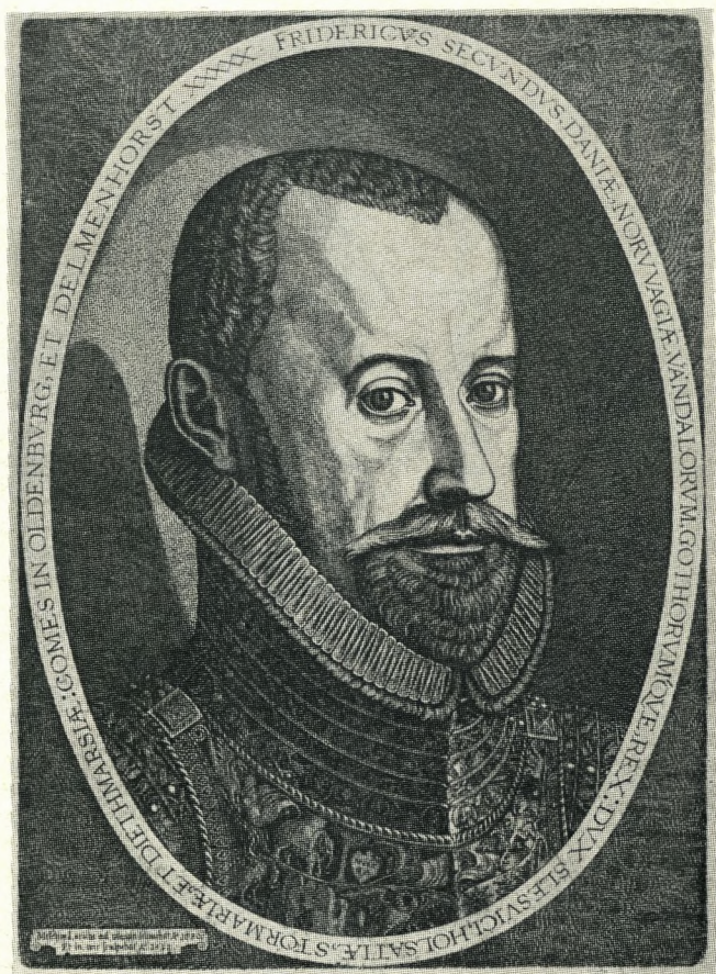
FREDERIK DEN ANDEN

Skolens stifter skal nu endelig have et mindesmærke.