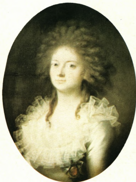
Kronprins Frederik (VI) og kronprinsesse Marie Sofie Frederikke, malt af Jens Juel 1790.