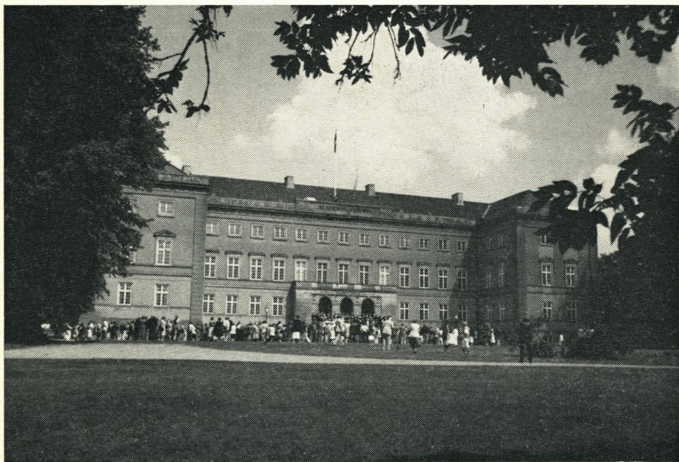
S. Gerner Andersen, fot.