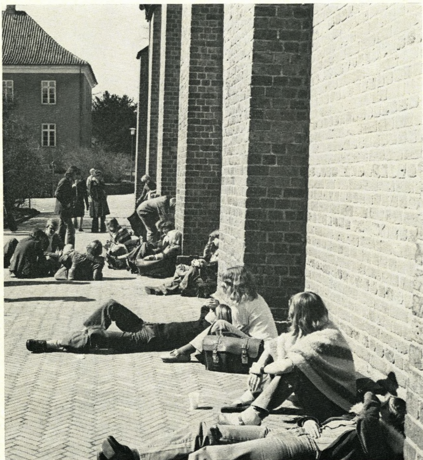
Frikvarter i Fratergården