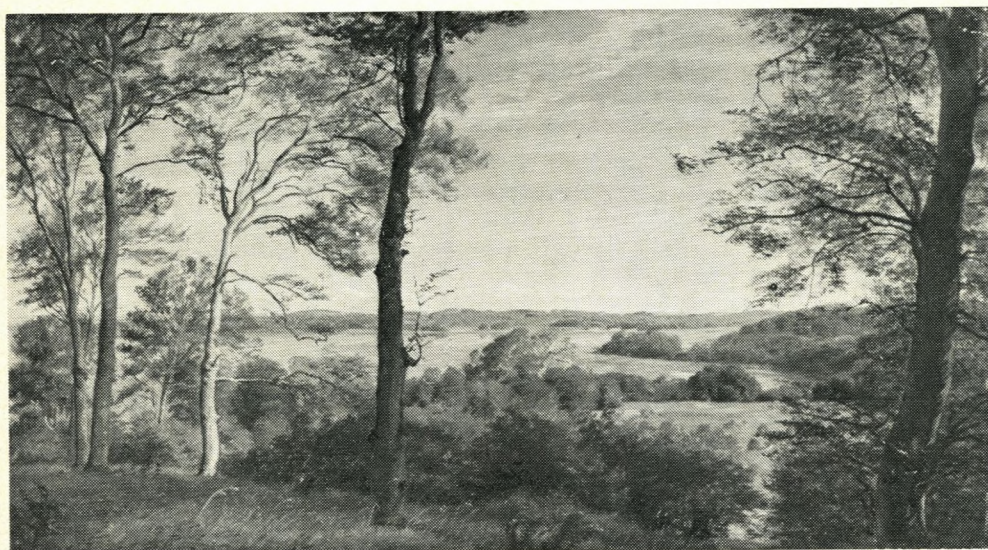
P. C. Skovgaard. Udsigt fra Skarritsø 1845