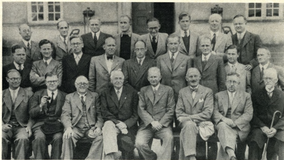
Sorø Akademis Skoles lærerkollegium i 1945.