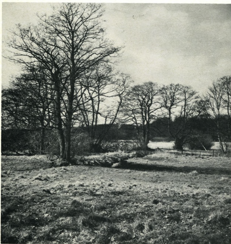
Forår. Stensbøgevej. Flommen i baggrunden.