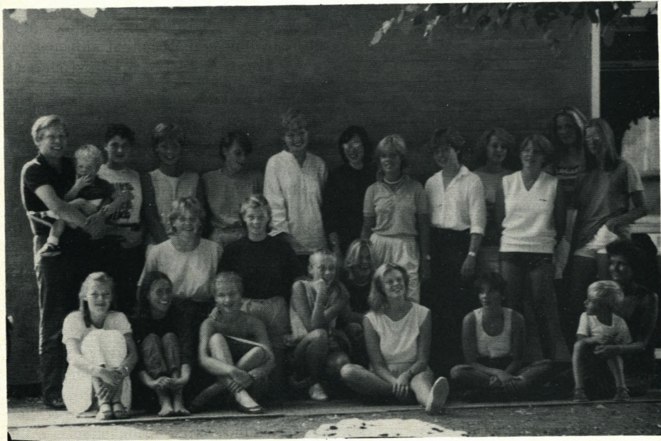
Den første årgang pigealumner