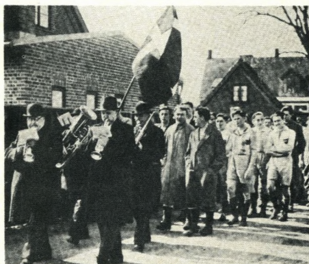
På vej gennem Birkerød til fodboldkamp 1939

Da Haslev ved slutkampen i 1939 havde vundet 4 gange ialt, fik de Trollepokalen til ejendom. B.K.S. udsætter så den foran afbildede pokal i Kostskolernes Po-