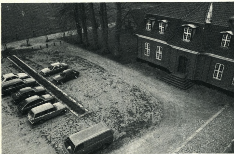
Batøkplænen foran Ingemanns Hus er nu blevet parkeringsplads