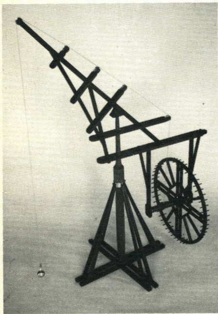
Nr. 58: Kranmodel. Træ og messing. Højde ca. 0,6 m. Ikke signeret. Muligvis dansk.

Dette afsnit indeholder 70 numre. For eksempel: Nollerts diagonalmaskine, modeller af brandsprøjter, kraner, gear, hejsemekanismer, Mariottes stødapparat, diverse flasker, legemer af forskellig form og materiale, Attwoods faldmaskiner, et marmorbord, en centrifugal maskine med tilbøher etc.