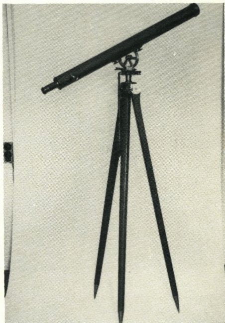
Nr. 548: Akromatisk kikkert. Hollandsk. Mangler søger. Højde ca. 2,2 m.

Her findes 45 numre. Apparater til demonstration af tryk, »Pascals vaser«, hæverter, forskellige »vandspring«, modeller af vandhjul, demonstration af opdrift etc.