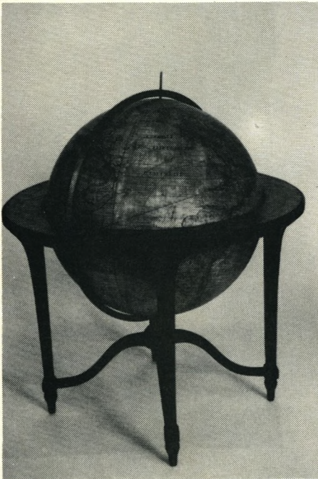
Nr. 570: Jordglobus. Diameter 24 tomm. Svensk, signeret Andr. Åkerman 1766.