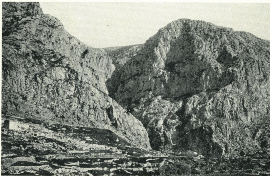
Fotografi fra Delphi