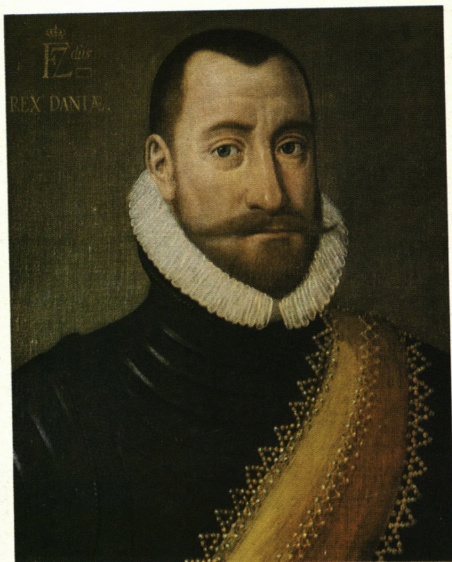
Frederik II, Danmarks og Norges konge 1559-86, skænkede sit og kronens kloster i Sorø til en »besynderlig og bedre skole den 31. maj 1586.