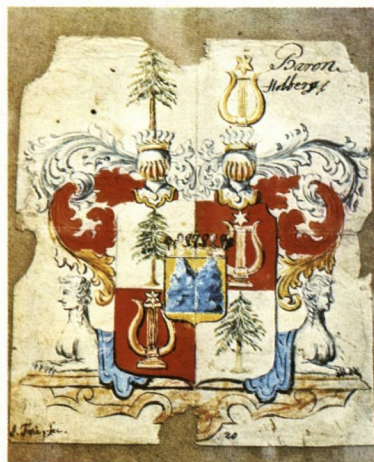
Fosies udkast til våbenskjold

1947). Det er sandsynligt, at den hvide, lodrette streg skyldes slid fra en fold, men det gælder ikke de to hvide pletter til højre, som nok skal markere belysningen af højre klippe.