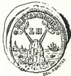
Holbergs borgerlige våben

Hertil kommer, at da friherrevåbenet blev tegnet i 1747, havde et bestemt norsk bjerg nok tillige fået et endnu dybere symbolsk indhold for Holberg, for da var Niels Klims underjordiske rejse udkommet (1741). Det var romanen om klokke-