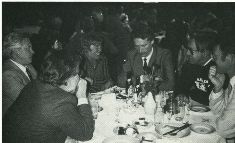
Onsdag formiddag!

soranersange »Jeg veed et Sted –« (på den traditionelle melodi), »Hellig er vor Ungdoms Lyst«, »Kong Fred'rik glæd dig i din Grav« (der jo traditionelt blev sunget til lovsang på stiftelsesdagen) og sluttelig »Concinamus, o sodales« – hvor herligt med latinsk sang i Fratergården! – Og så