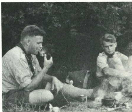
Forfatteren og anmelderen på tur i Jylland 1953

Men selvom bogens billeder er dejlige, er det dog teksten der bærer det hele, i sin egen stilfærdige ret. Det egentlig historiske afsnit fylder to tredjedele af bogen og kan læses som en instruktiv beskrivelse af den der første gang stifter bekendtskab