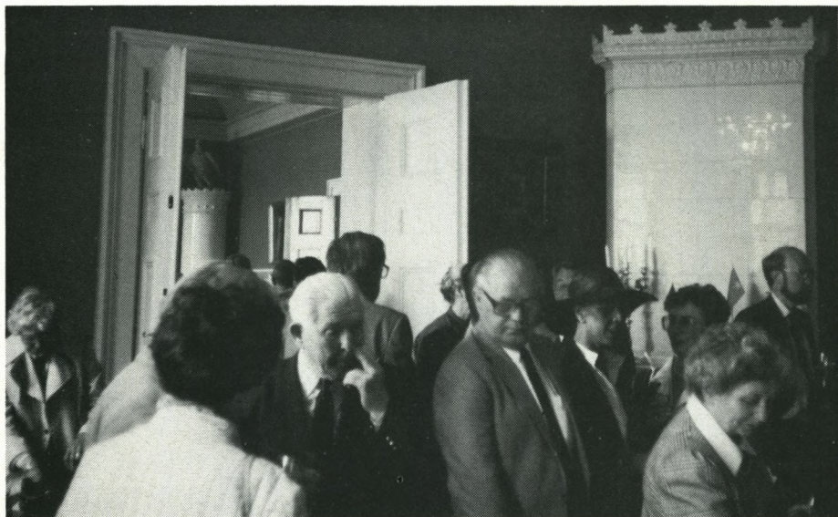
Der var trængsel ved champagnen

kom med på billedet i avisen – hendes far tog kort tilløb og sprang over hækken, men det var der ingen, der knipsede!