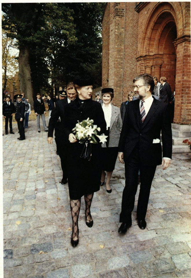
Dronningen kom alligevel til 400 års jubilæet den 3. oktober 1986.