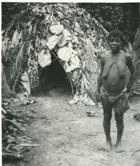
Balese-pygma poserer foran enfamiliehuset. (Ituri-floden, Zaire).