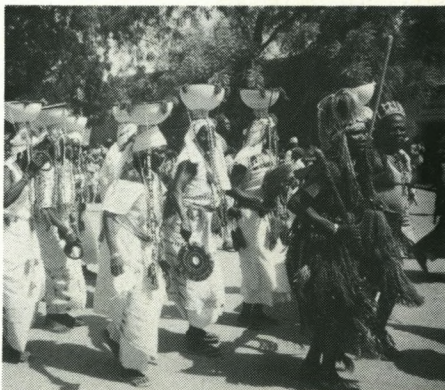
Ramadan-hyldestoptog til Emirens ære. (Katsina, Nigeria).

IN GUEZZAM – Algeriets grænseby til Niger. Topmålet af det afrikanske bureaukrati oplevede vi på denne sandede udpost, hvor grænsegendarmeri og told-