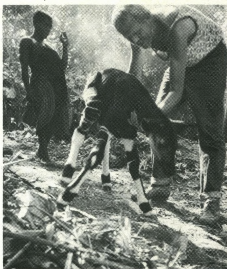
Nyfanget 5-dages okapiføl, stadig vakkelvoren. (Ituri-regnskoven, Zaire).

sove mellem en snes små bladhytter, mens palaveren gik om de mange kogebål. På jorden lå vi den nat, lige uden for en lille indhegning, hvor den netop indfangede 5 dage gamle okapiunge utålmodigt savnede sin mor!