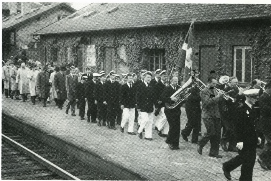
Soranerstortur til Sorø 1953.