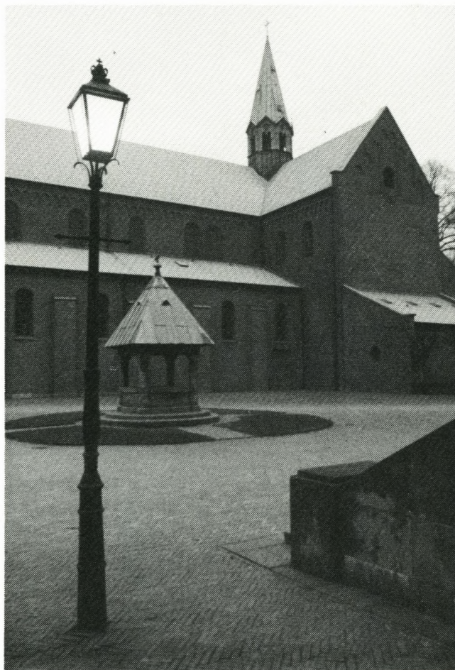
Morgenstemning i Fratergården.