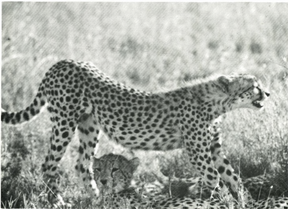
Geparder i Nairobi Nationalpark, Kenya.