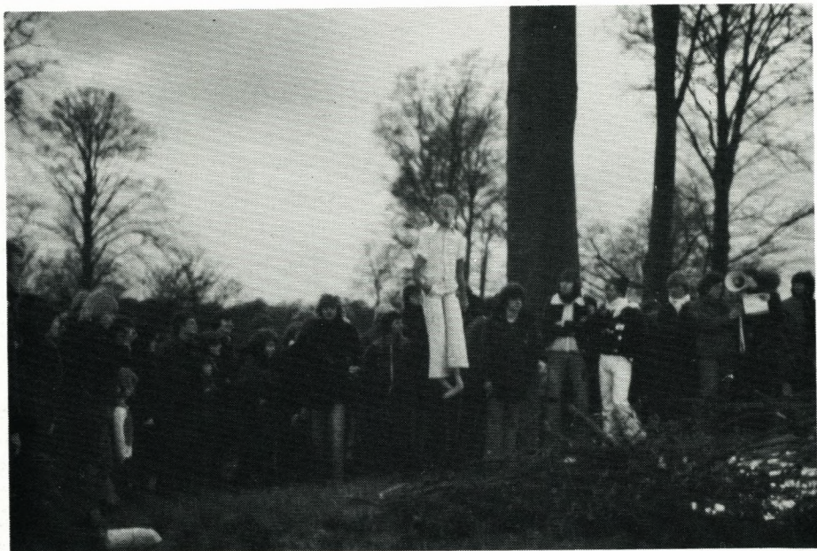
»Overskæringen« på Rævebakken ved Stensbøghuset er på retur.