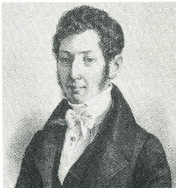
Carsten Hauch 1790 – 12 maj – 1990