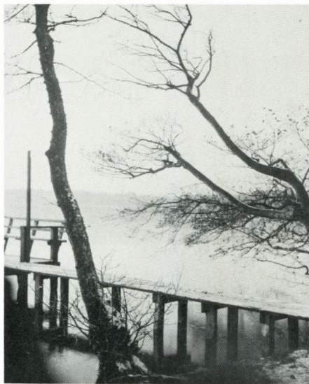
Dommerbroen i Akademihaven ved Kinahøjen er forlængst borte.

Hvis nogen er i stand til at oplyse nærmere om disse begivenheder, så skriv om det!!