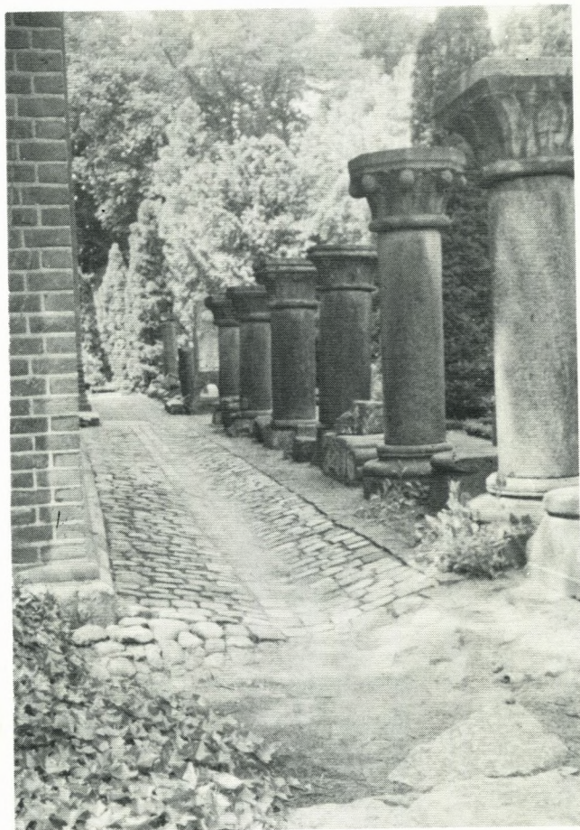
En række søjler fra Sorø Kloster står på den gamle kirkegård ved nordre korsarm.