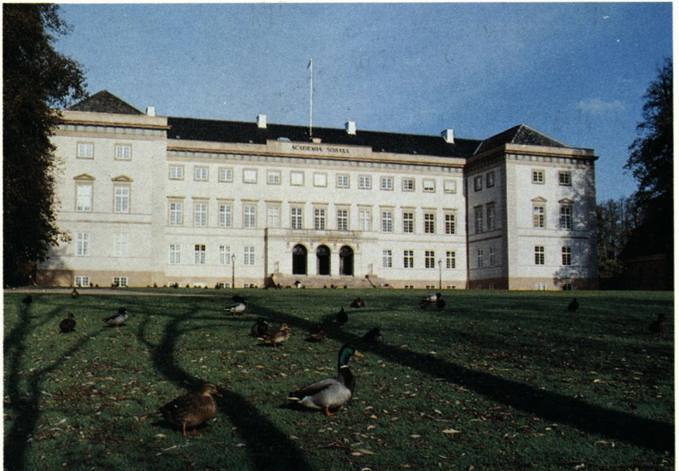
Sydfacaden af det nyrestaurerede Sorø Akademi.