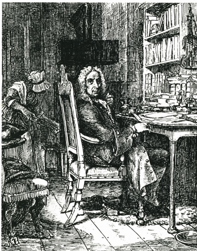
Ludvig Holberg i sit arbejdsværelse på Tersløsegaard, tegnet af Wilhelm Marstrand.