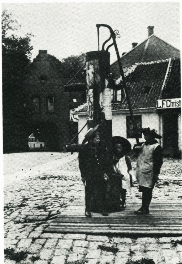
Sorø Torv 1901.

(1945).