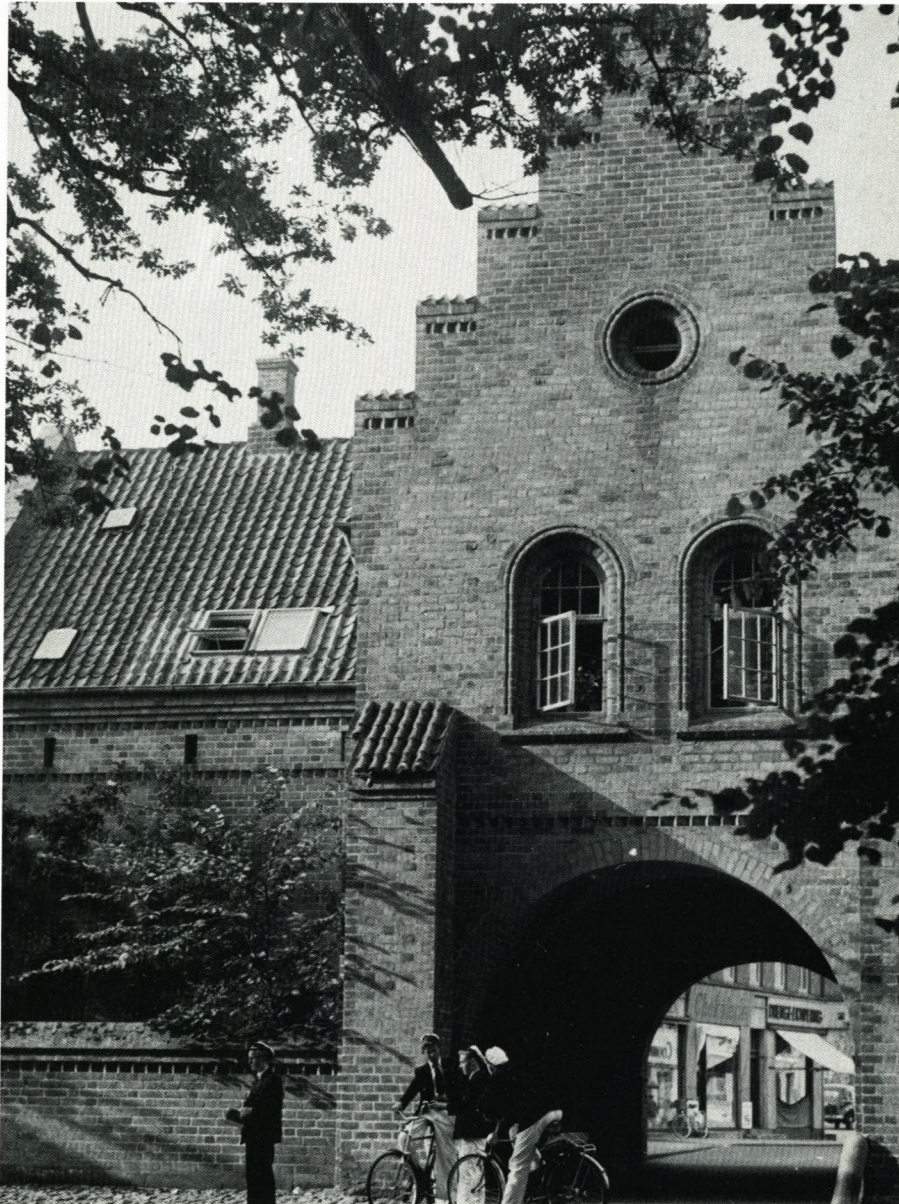
Klosterporten, det ældste beboede hus i Danmark, har også VELUX ovenlysvinduer.