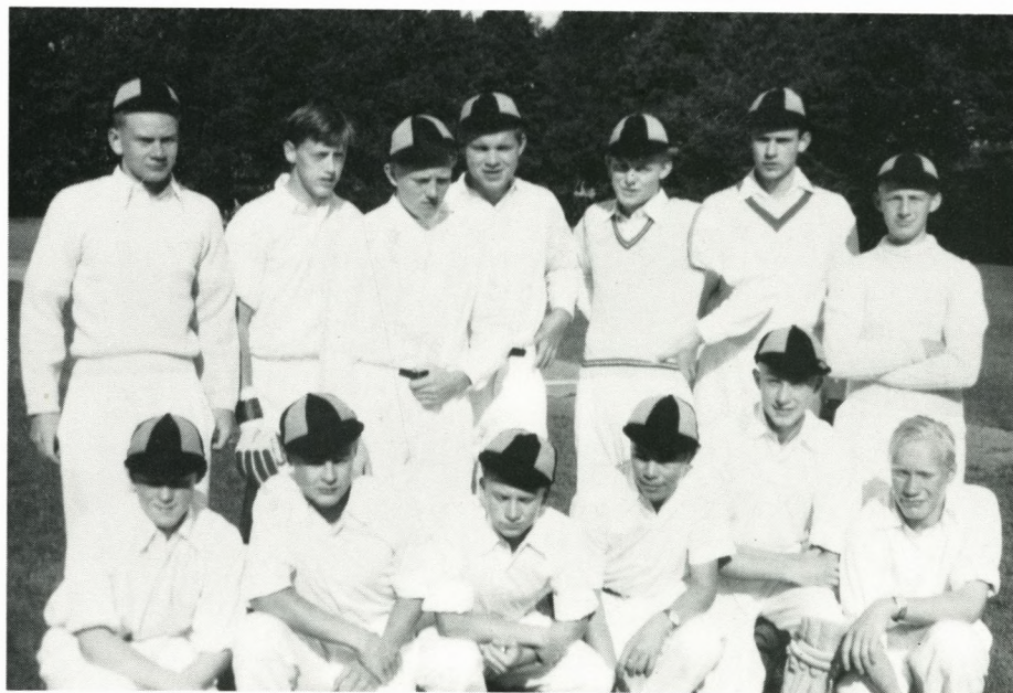
Hvem er med på søndag den 4. september?