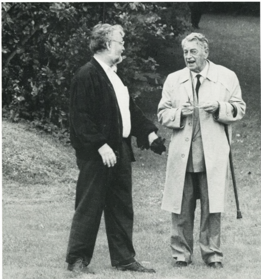
100 års jubilæumskamp den 4. september. Blandt gæsterne sås ...