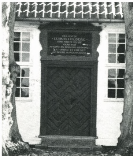
Hovedindgangen til Tersløsegaard.

Da Holberg døde, efterlod han sig blandt andet et testamente, der bestemte, at der til enhver tid skulle være bolig for en »Skikkelig Enke« på Tersløsegaard. Det har hidtil været nogenlunde let at finde egnede damer, men bestyrelsen har måttet erkende, at den pågældende fribolig har stået tom et halvt års tid efter, at