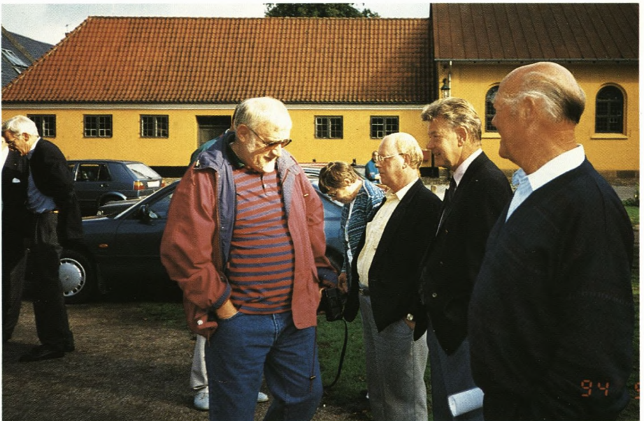
Det er ikke »Bugpressen«, redaktøren repræsenterer, men man kunne godt få en anelse når man kigger nærmere efter...