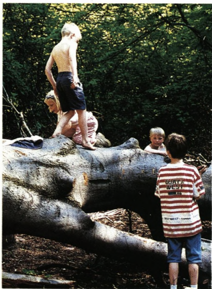
Ingen anstrengelse skyes for at skaffe kæppe.