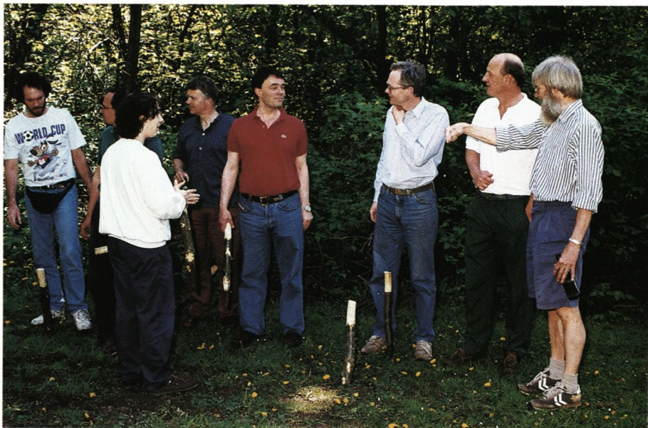
Strategierne forsamlet til planlægning. Hvem sagde Marstrand.