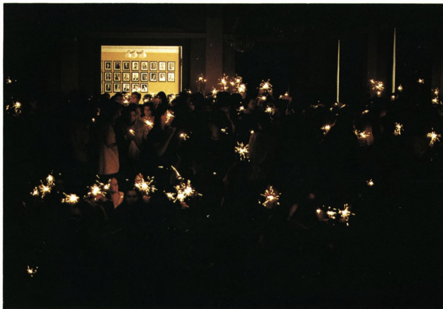
Stemningsfulde minutter ved morgensamlingen.