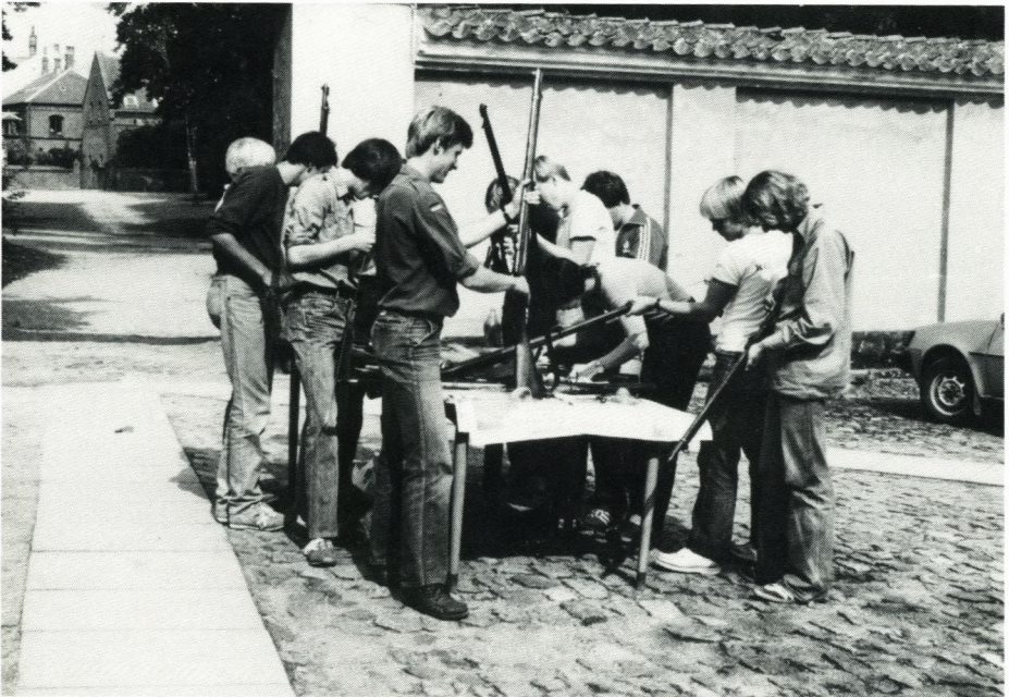
Skytterne årgang 1981/82.

Han fortsætter: “Det er i højeste grad barnagtigt, men griber ikke desto mindre