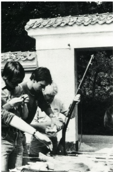
De pudser stadig!

Når netop militærvæsenet var det Højre og Venstre havde valgt at strides om, og når Estrup havde oprettet et militært gendarmeri for at holde landet i ro, så er det ikke