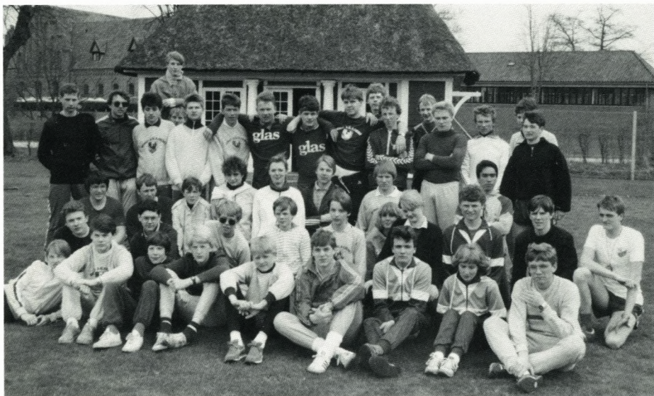
Orienteringsløbet Sorø-Herlufsholm foråret 1985.

I de første år var deltagerne inddelt i grupper og delinger, og træningens militære præg viste sig bl.a. ved etableringen af en feltbane, komplet med rævegrav med blindveje, i Bromme skov. 11