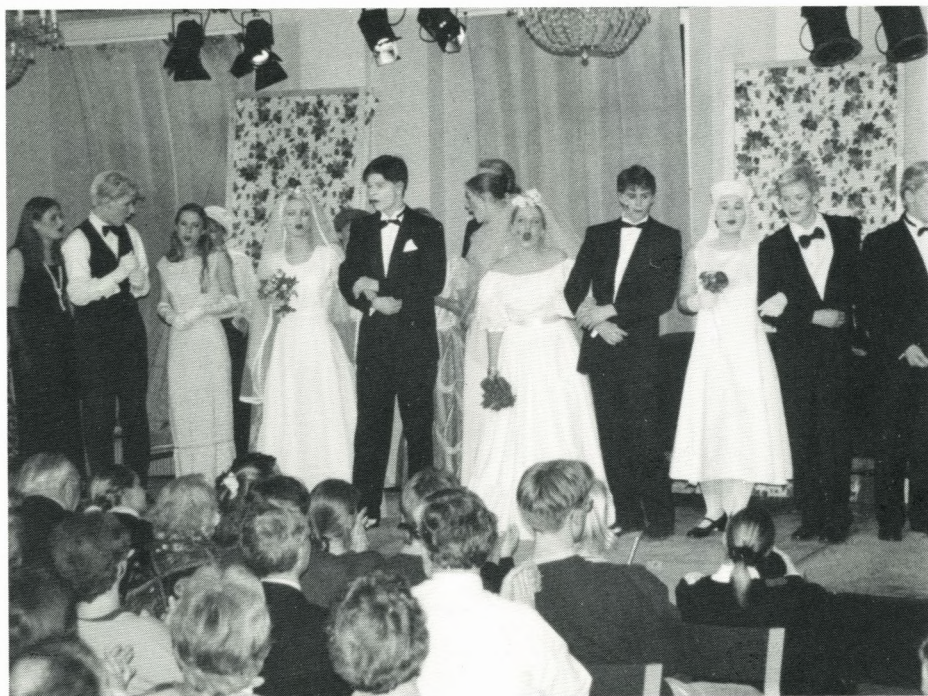
Slutscene: 3 brudepar!