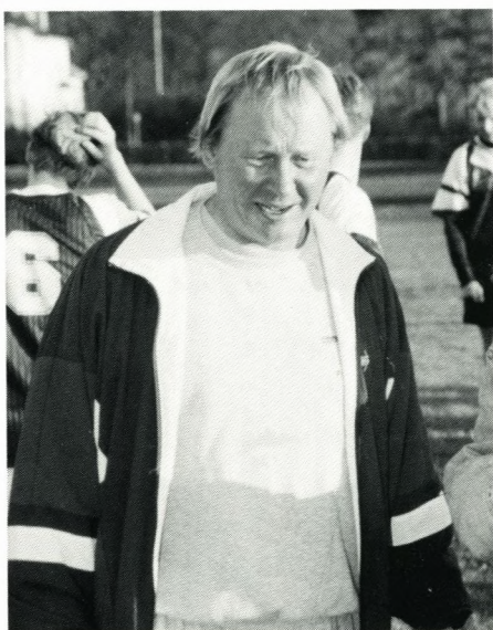
Se referat andetsteds i bladet.