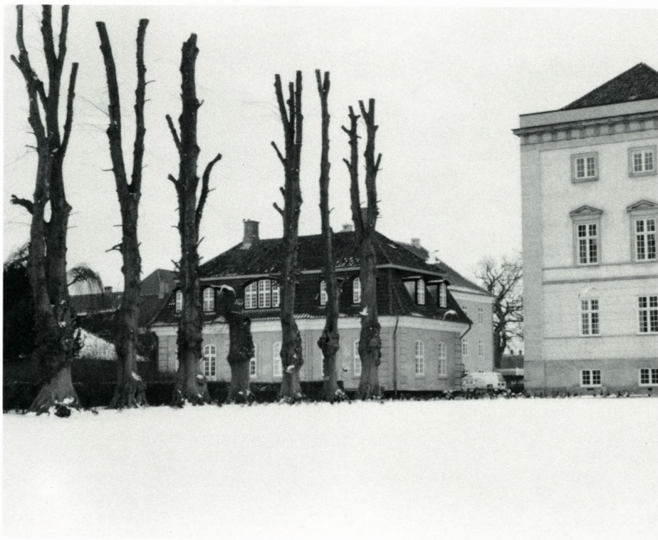
Det skal være skidt, før det bliver godt.