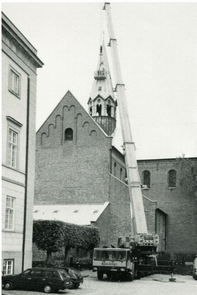
Hvem der dog besad slig en maskine til det årlige eftersyn af tagrenderne.