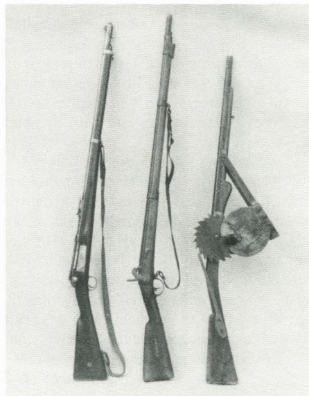
Fra Jul i Sorø 1996.