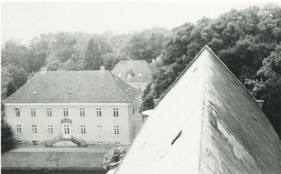
Rektorboligen set fra kirkespiret, det ligner sig selv, men der er dog sket meget siden, bl.a. nyt tag, ny facade.