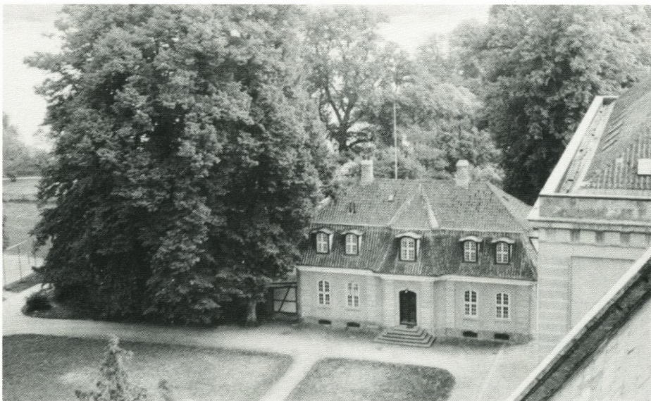
Ingemanns Hus set fra kirkespiret år 1953. Bemærk den tætte bevoksning og den nærmest tilgroede have.

Sidste blads forside bragte billedet af kirkens spir set fra Ingemanns Hus, denne gang ser vi den modsatte vej.