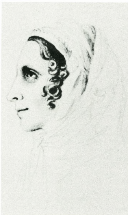
Lucie Ingemann, tegning fra 1849.