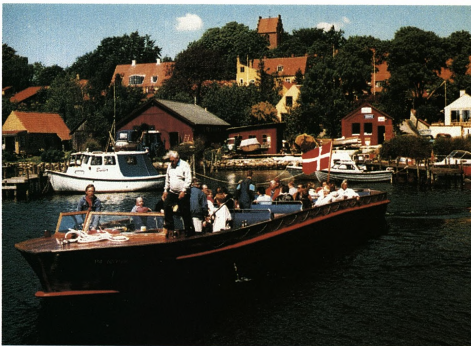
Det er sådan en skude, initiativgruppen har i kikkerten!

Herefter skal båden være "en gave til os allesammen". - Ingen skal kommercielt tjene på et evt. driftsoverskud. - Båden skal