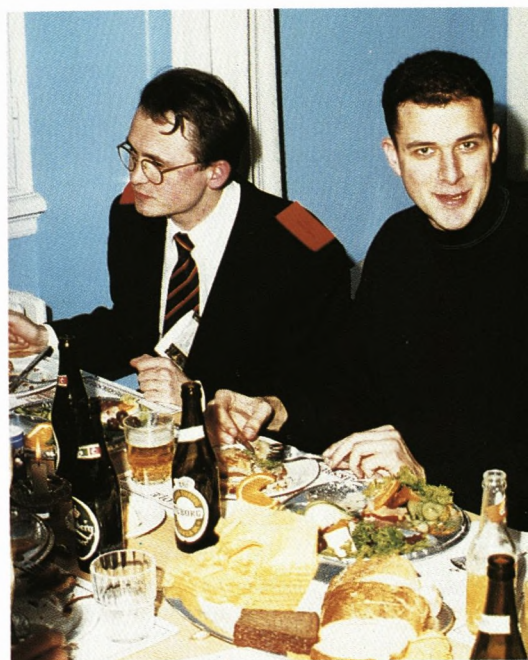
En referent høster sin løn: Barlyng nyder en gratis omvisning på Frederiksberg Slot!