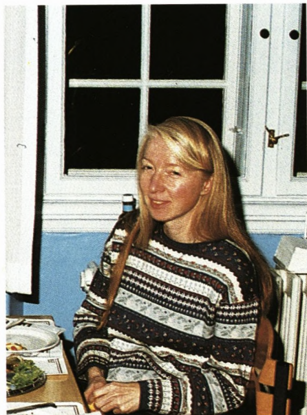
Lonnie nyder den gode stemning.