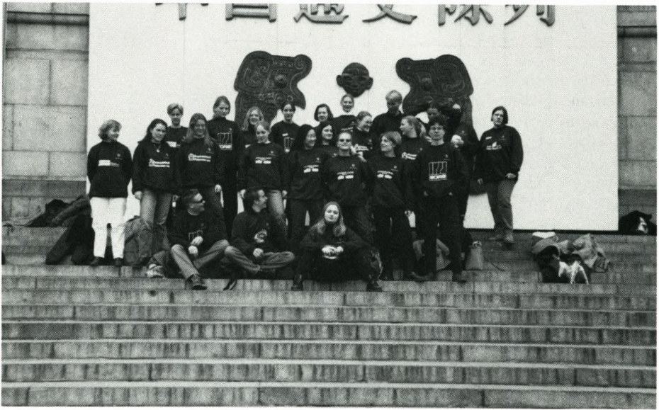
Rejseholdet på Den Himmelske Freds plads.