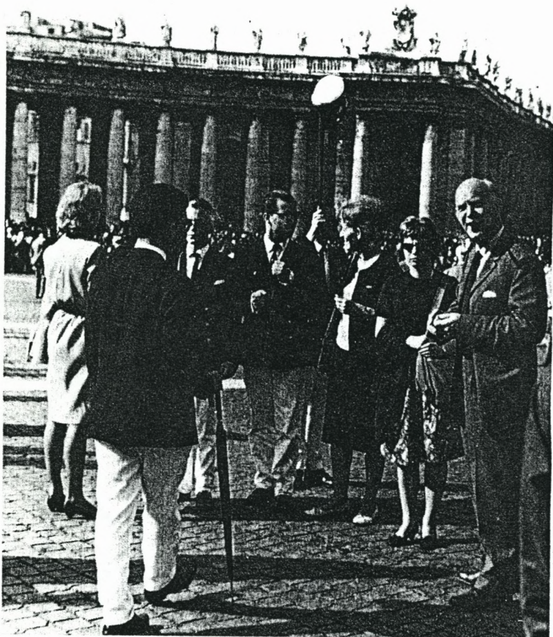
Soranere på Peterspladsen i Rom 1962. se kommentarer inde i bladet.