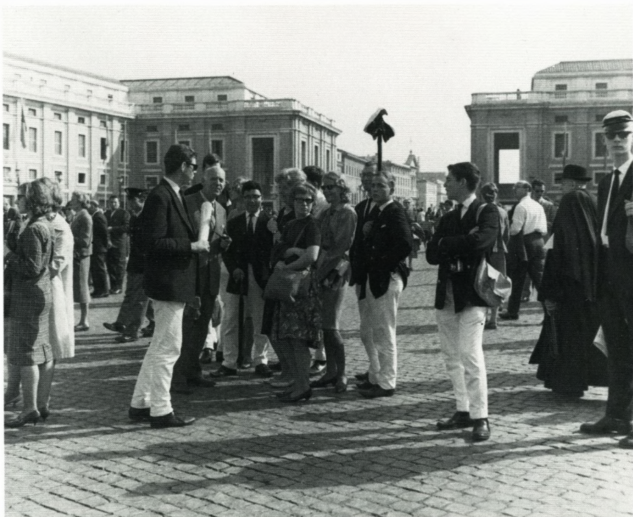
Glade dage i Rom.

rødvin og gnavede stykker af et mirakuløst italiensk brød. Det var at leve! Ingen senere restaurantbesøg og gourmetoplevelser har for den, der skriver disse linier, kunnet udkonkurrere disse bohème-måltider på Roms høje.