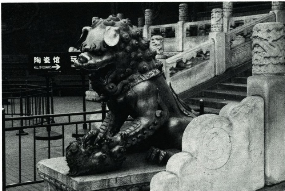
Her vogtes dragens guld.