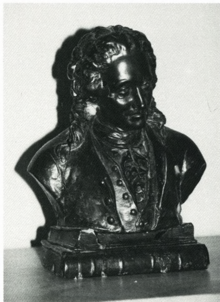
Holberg-buste i hjemmet hos denne artikels forfatter - fremskaffet i 1995 ved mellemkomst fra redaktøren af Soraner-Bladet.

Og denne situation er præcis det modsatte af situationen først i 70'erne, da jeg gik på skolen. "Oprørsårgangene" som Hemming mente, eftertiden har døbt os 3 , ville afskaffe uniformen, have friere betingelser på alumnaterne, reducere antallet af regler, have mere indflydelse osv. Dengang stod vi overfor en meget overvejende konservativ skoleledelse og næsten tilsvarende lærerstab, som ikke ville forandringer og kun nødtvungent gik i diskussion med elever og alumner om sådanne.