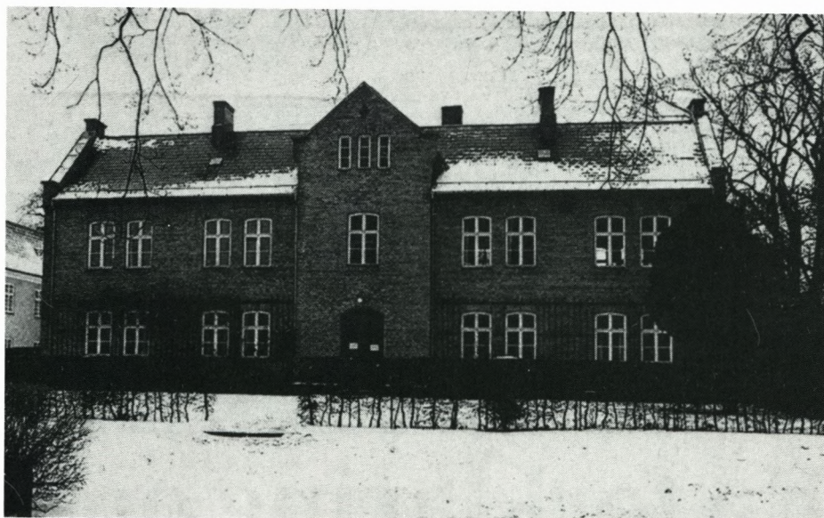
Det nedlagte sygehus må lade livet.