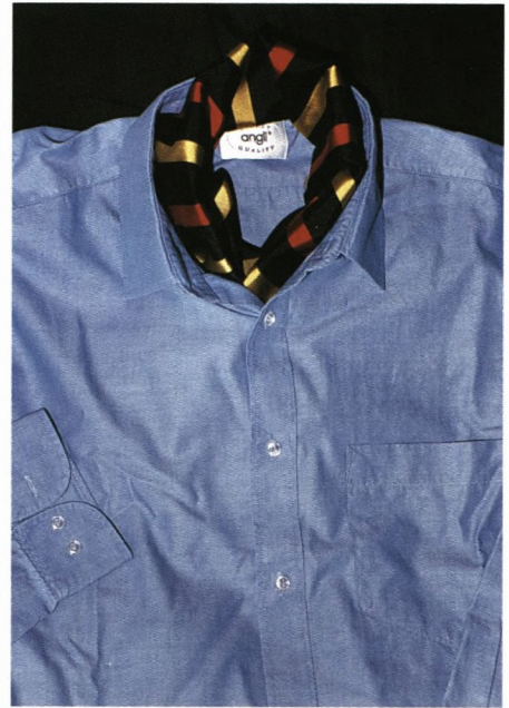
Fredriks forslag - se næste side.