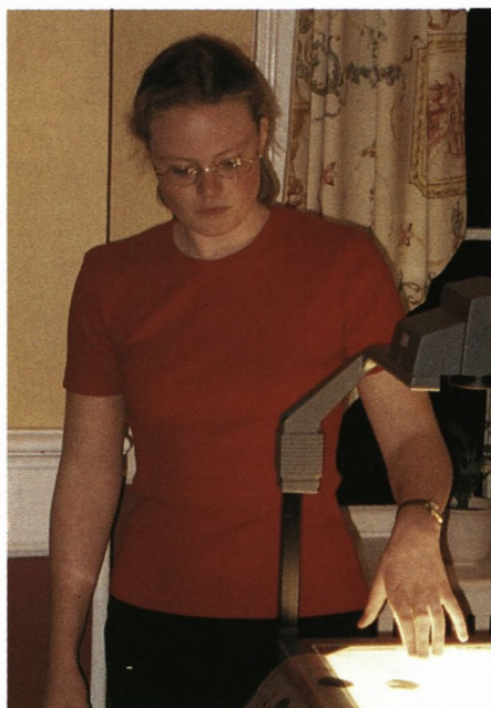
Line (S 94) fremlægger præciminære resultater fra rundspørget.