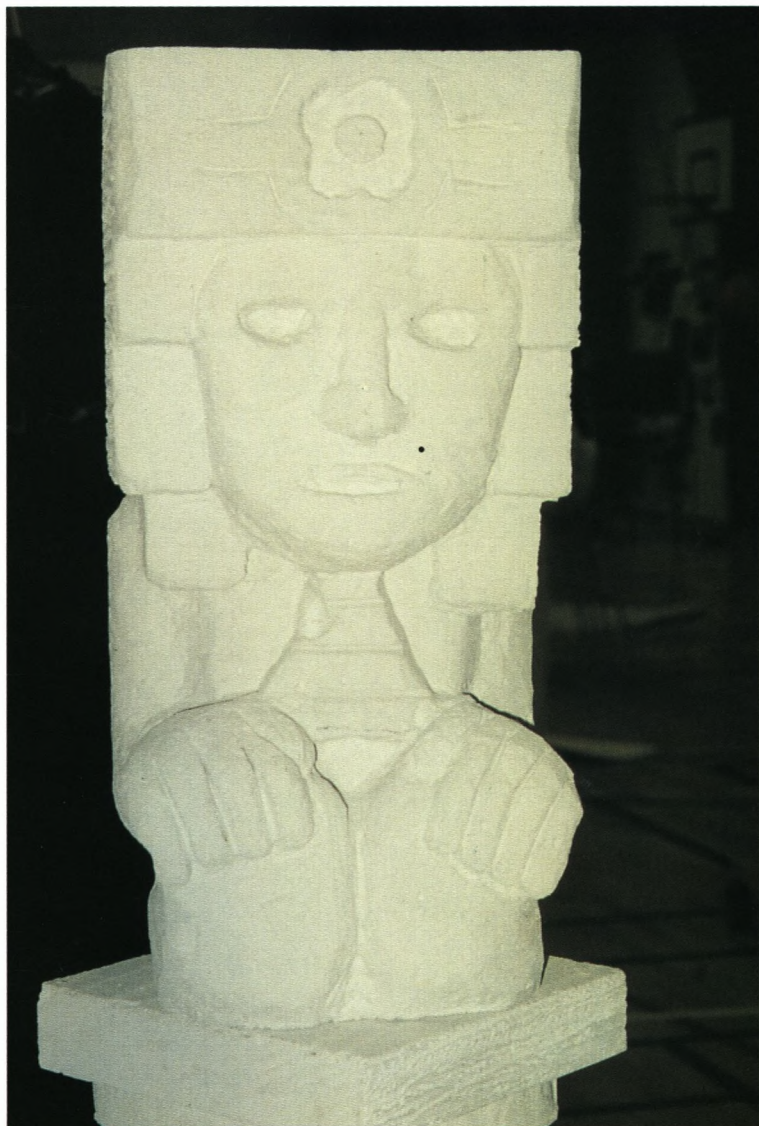
Mexikansk gasbetongud - fra skolens projektudstilling i hallen.