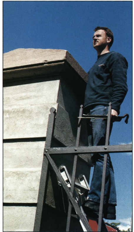
Det ses her tydeligt, at kanneluren er udslettet af vind og vejre.

Nu havde man i god tid spekuleret sig gal på, om man kunne være bekendt at lade kongen køre ind til skolen gennem byens såkaldte stræde, der ikke alene var meget smalt, men også forekom aldeles uhumske og i hvert fald ikke kunne - eller burde - tjene som adgangsvej for et så fornemt selskab som kongens! Man enedes derfor om, at lade majestæten køre gennem Filosofgangen, hvis man i øvrigt kunne få den sat i stand og gjort kraftig nok til at bære kærterne.