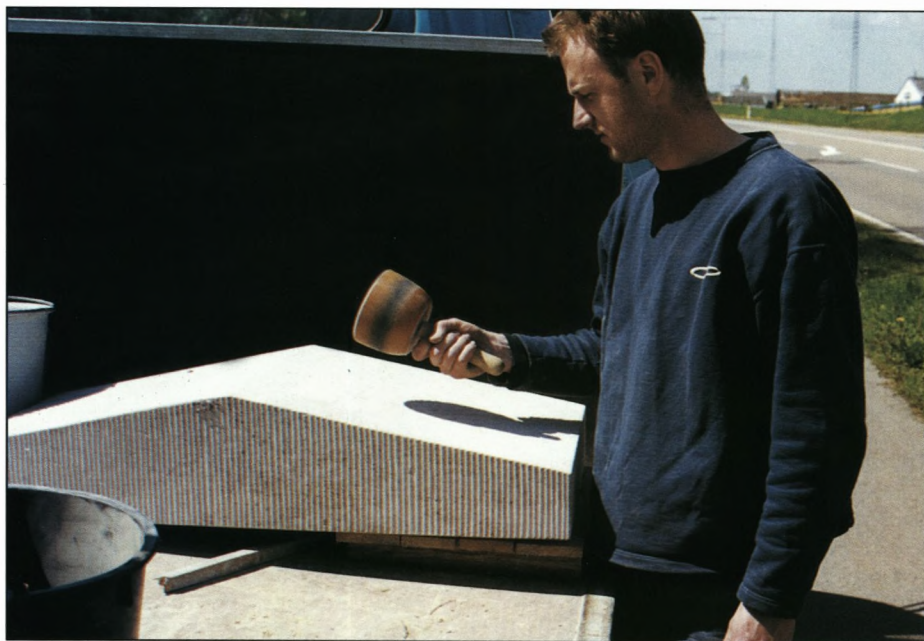
Stenhuggeren ses her ved en af de nye (halve) overliggere. Kanneleringen er udført i hånden!! Med knippel og mejsel -.