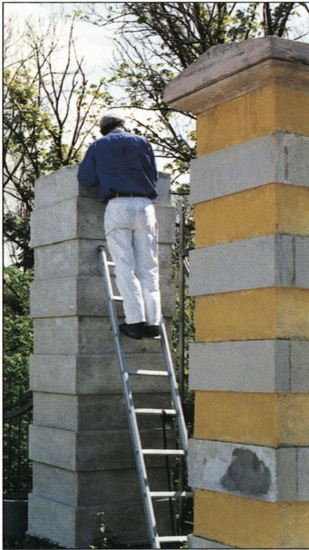
Et stadium på restaureringens vej -.

Omkring ved denne tid ses det af regnskaberne, at møllediget skifter navn til Den Philosophiske gang, hvorved man kan opfatte det således, at der rent faktisk sker en ændring af digets status fra kun at være dige til nu at være en gangvej eller sti ind til skolens område. Dette knæsættes for alvor, da kongen, Frederik d.III, i 1654 giver tilladelse til at udføre diget som en spadservej fra Kongevejen til Fiskerhuset, som er den nuværende skovriderbolig.