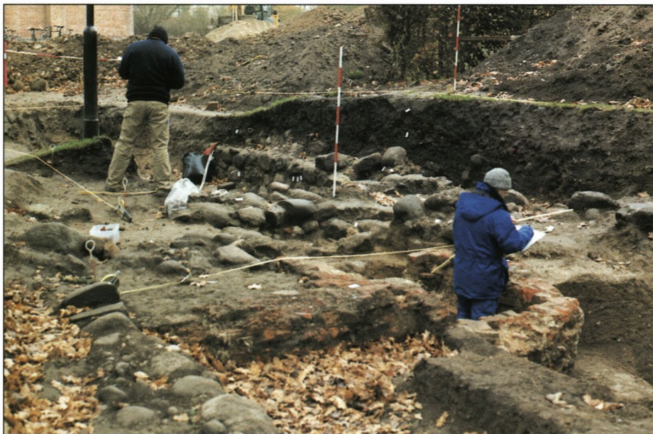
Stor aktivitet ved sygehuset.