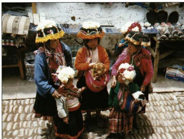
Indianermarked i Pisac.