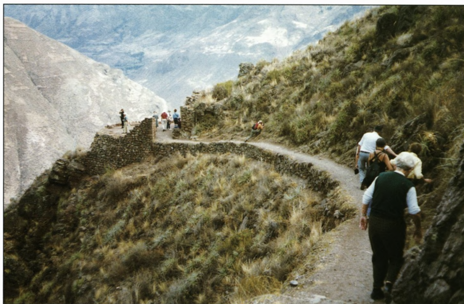
Stejle stier / Pisac.

Det blev indtryk, som næsten kun kan sammenlignes med Faraonernes præstationer. Mure med ofte manglekantede klippeblokke, op til 2-3 m på hver led og sammenføjet uden mørtel med en nøjagtighed, så et knivsblad ikke kunne finde vej mellem dem. Stenblokke, der var slæbt ned ad bjergsider, over floder og op til de strategiske højder, hvor fæstningerne blev bygget. Mure, som stadig er fundament for mange af de bygninger, spanierne rejste i byen, kan beundres i gadebilledet. Og for resten i