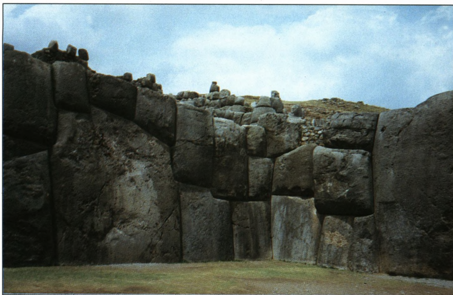
Inkamur i Pisac.