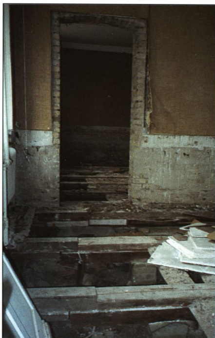
Et kig ind gennem døren til "privaten" - bemærk gulvbjælkerens format!

Til de mange, som har ringet og spurgt, om man dog ikke kunne have tjent en skilling ved at have foranstaltet en auktion over alle disse ting med relation til sygehuset, skal dette altså tjene til en forklaring på, hvorfor det IKKE kunne lade sig gøre!