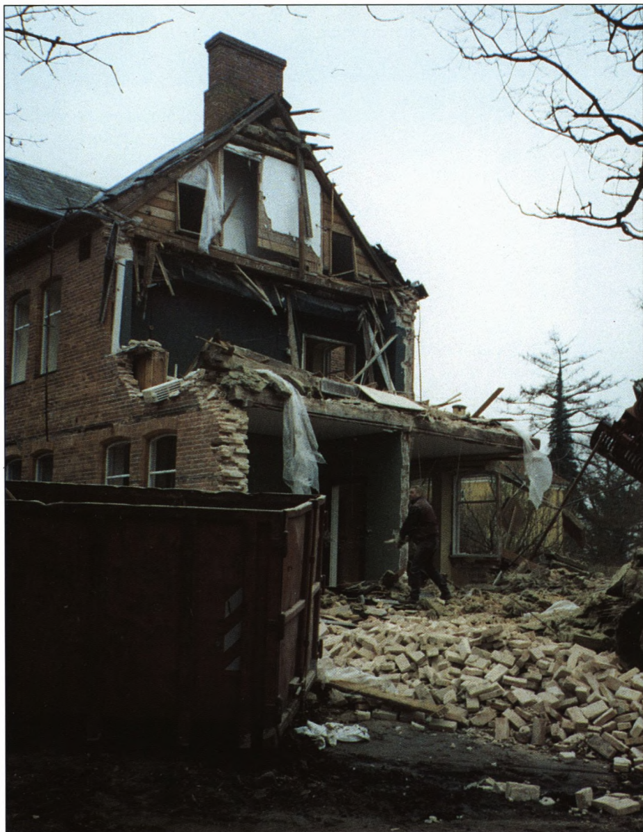
Det kraftige murværk i stueetagen skal bære den mindre opmuring i førstesalen.

Af billederne fremgår, at ikke alene opmuringen er solid, men læg mærke til gulvbjælkerne og de OPMUREDE understøttere - denne bygning var opført som en kirke til at holde i tusinde år.