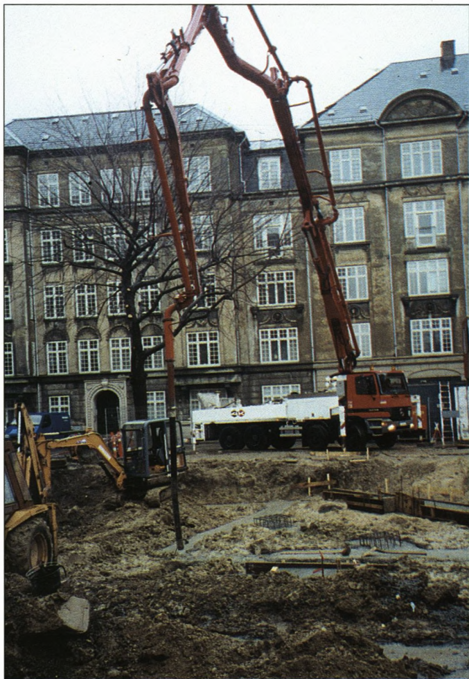
Grunden til Soranernes Hus er lagt. - Stankelbenet er en beton-pumpe!