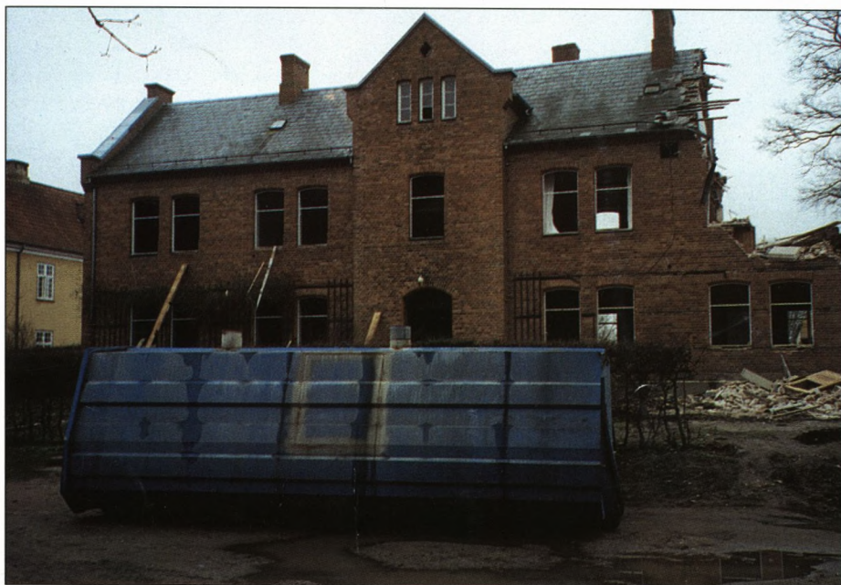
Sygehuset under nedbrydning. - I forgrunden ses sarkofagen ...

02079 RHC 1965010 000 ROLF HARDY CHRISTENSEN VIOLINVEJ 32, ST. 2730 HERLEV 2730 o 16/17 1