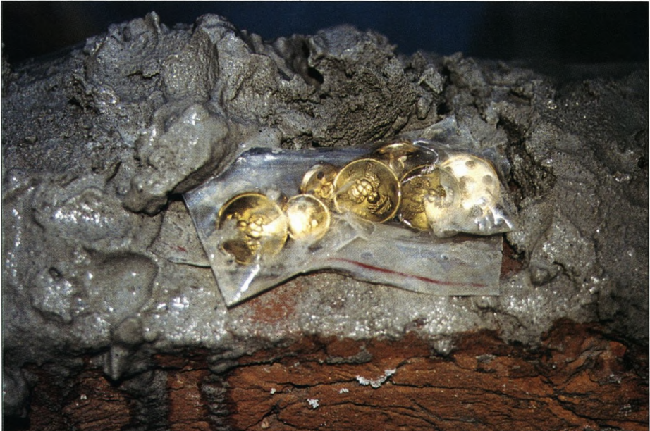
De indmurede soranerknapper imellem stenene.