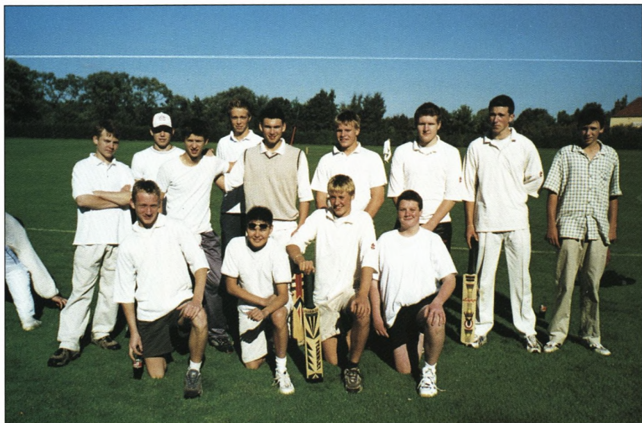
Skoleholdet. Navne på næste gang!