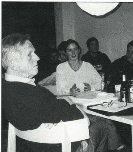
Formanden i et fællesrum.