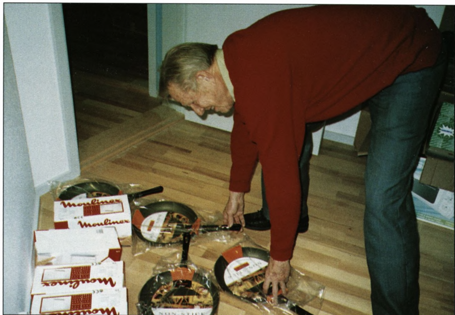
Formandens isenkrambil rummede meget godt.