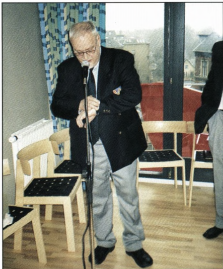
Redaktøren styrede den tidsmæssige afvikling med hård hånd.