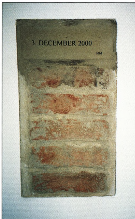
Æresstenen indmuret oven over munkestenene.

Det var en dejlig dag - vi venter nu spændt på at få det HELT færdig så vi bl. a. kan anvende salen efter dens formål.