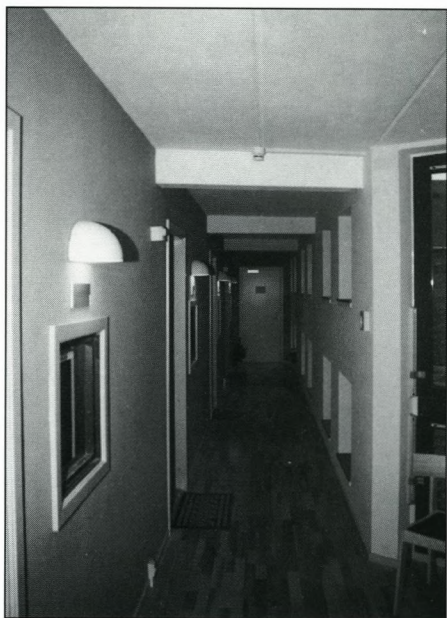
Søndre fløj af Blå Gang i Soranernes hus. Bemærk det flotte parketgulv og den dobbelte vinduesrække mod gården.

Ved det nyligt afholdte husmøde på Soranernes Hus opfordrede redaktøren af Soraner Bladet mig til at fremsende denne lille hilsen fra beboerne på fjerde sal. Samtlige lejligheder på denne etage er nu beboet, idet to australske udvekslingsstudenter i forgangne uge flyttede ind i etagens sidste ubeboede lejlighed.