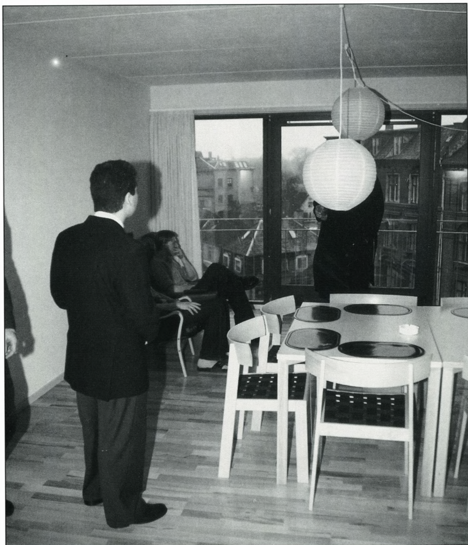
Parti fra fællesrummet på 4. sal. Stole og borde stammer fra Sorø Stolefabrik. Der kommer snart noget på væggene!

Nuværende studie: Levnedsmiddelstuderende på 1. år.