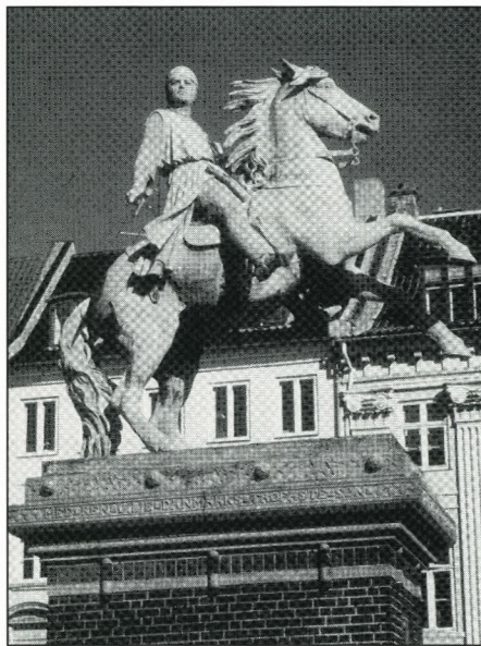
Absalon som vi kender ham bedst fra Højbro Plads. Det er ved indvielsen af denne statue, Georg Brandes ikke fik lov at holde talen!

Han værger landet til søs og til lands, stor i forsvar som i angreb. I denne kronragede, katolske bisp stikker der en oldnordisk viking, der fører et vagtskib. Rytterge-