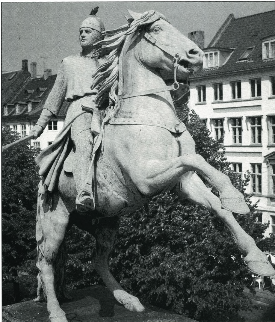
Statuen i dens magt og vælde. Bissen fecit.

I hin tid, hvor de andre føler sig som sjællændere, jyder, skåninger, og hvor landet så nylig havde været delt mellem tre konger, føler han sig dansk. Han værger Danmarks uafhængighed efter at have betrygget freden på dets kyster. Han har elsket dette grønne land i det gråblå hav.